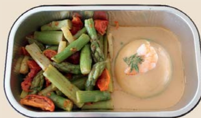
Dôme de Saint-Jacques, sauce langoustine et poêlée d'asperges vertes

La livraison des courses ou une aide administrative sont également possibles.