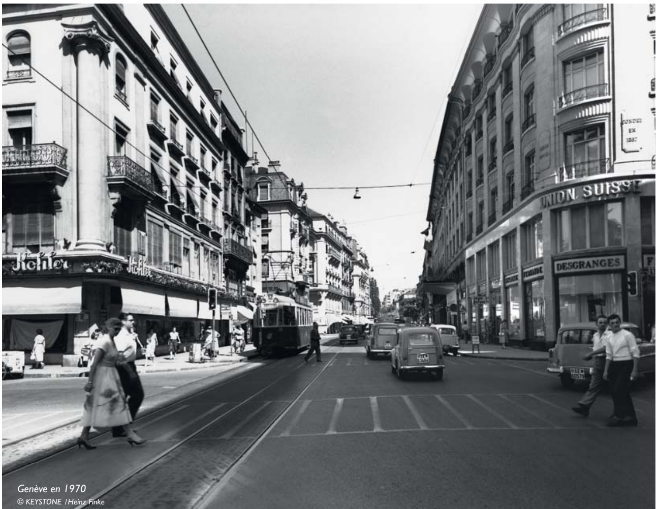
Genève en 1970