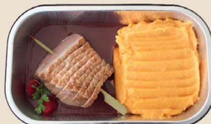
Purée de carottes et magret de canard sauce framboise